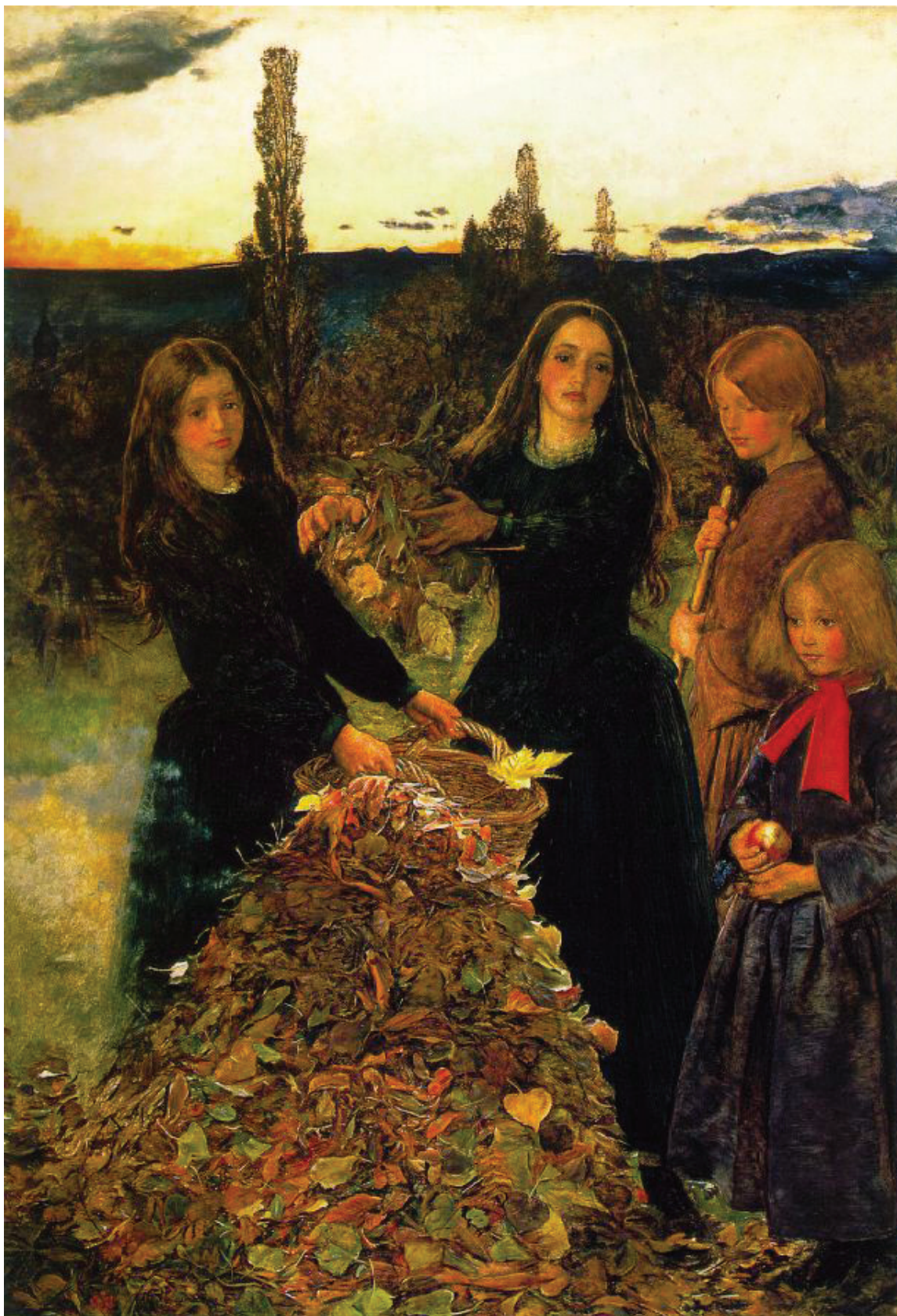
Foglie d'autunno di John Everett Millais